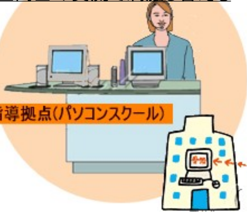
指導拠点(パソコンスクール)