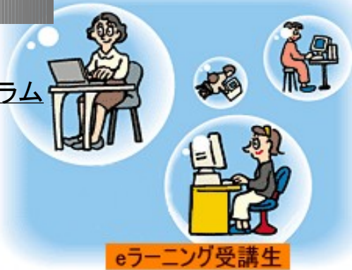
eラーニング受講生